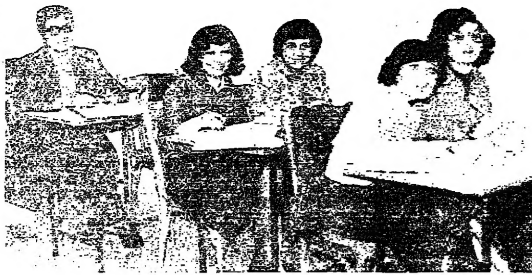
داخل احد الصفوف في معهد الآداب الشرقية

استأنفت المدارس حياتها الاعتيادية أمس وقد تجاوب الطلاب مع دعوات التهيئة وكان الحضور كثيفاً كما عسى الأيام العادية . وفي الكليات الثانية للجامعة اللبنانية ، لوحظ ان الدراسة تجري بشكل طبيعي . والجامعة السورية فتحت ابوابها كالمعتاد . وتتم اتصالات بين كل من منظمة الطلاب الاصرار ومصلحة الطلاب والكتائب لتخصية الذبول واعادة التقامهم والتسيق .